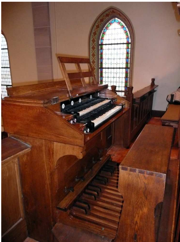
Console de l'orgue