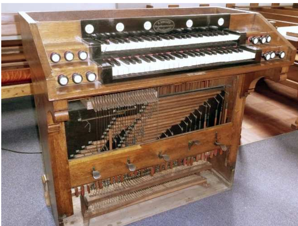
Mécanique des claviers et du pédalier